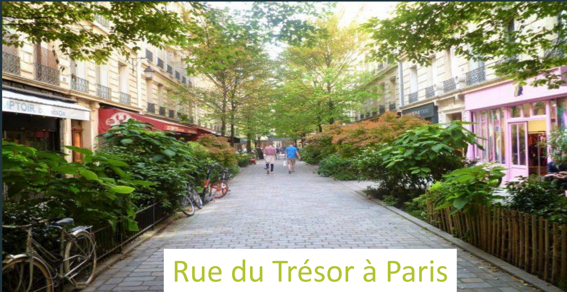
Rue du Trésor à Paris