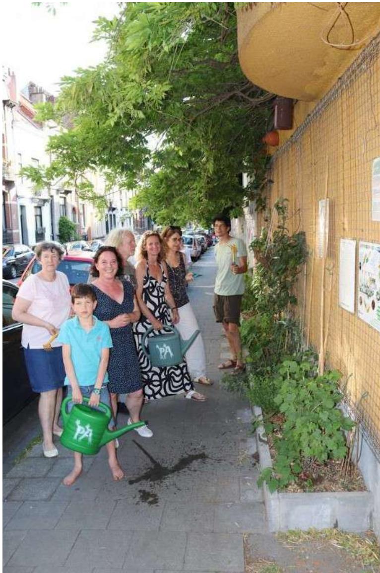
Dans l'espace public / In de openbare ruimte