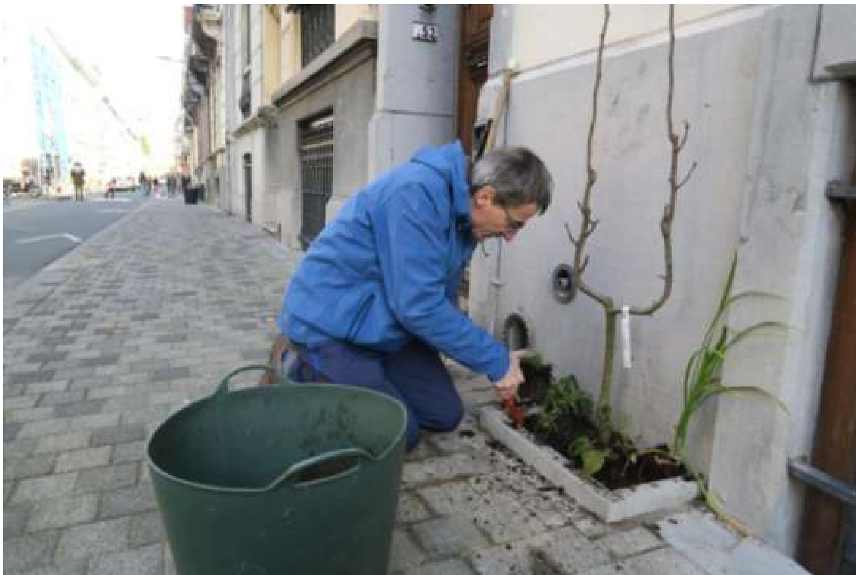
Le verger du trottoir d'en face - Schaerbeek / Saint-Josse