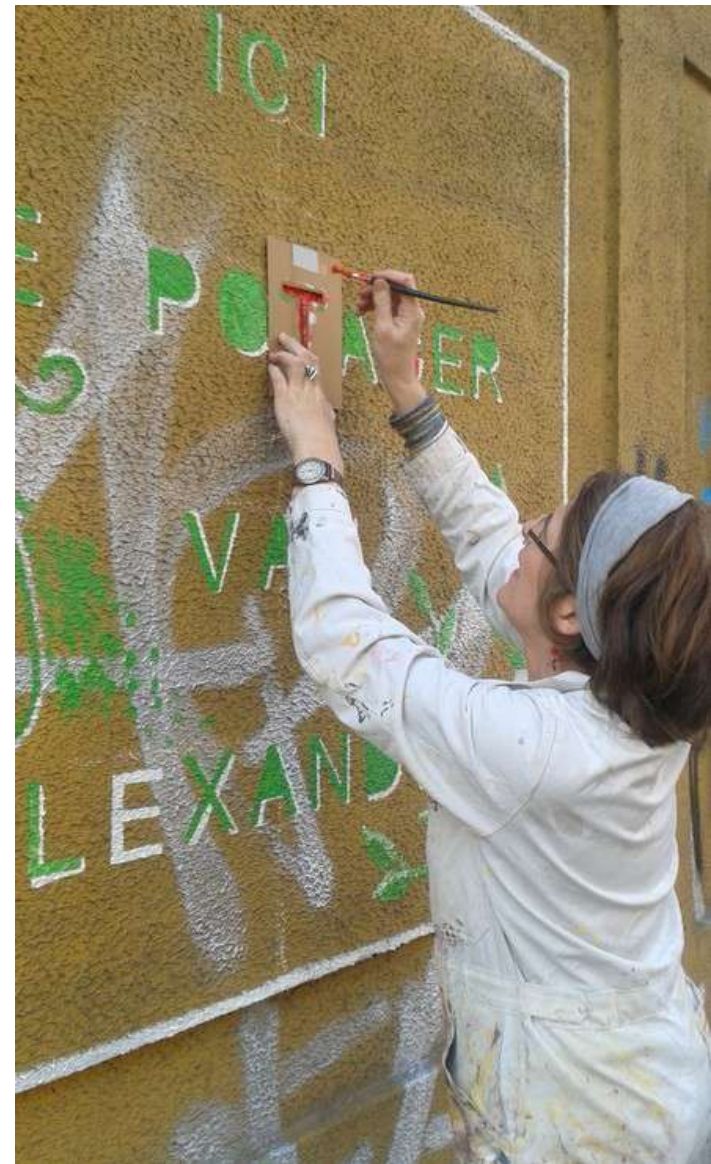
The potager van Alexandre - Schaerbeek