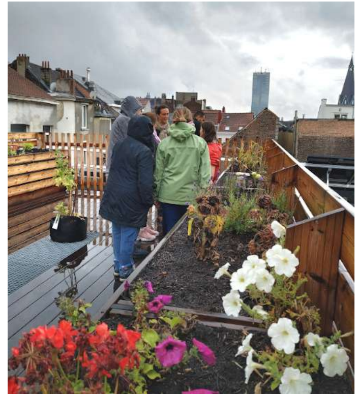
Casa Viva - 1000 Bruxelles