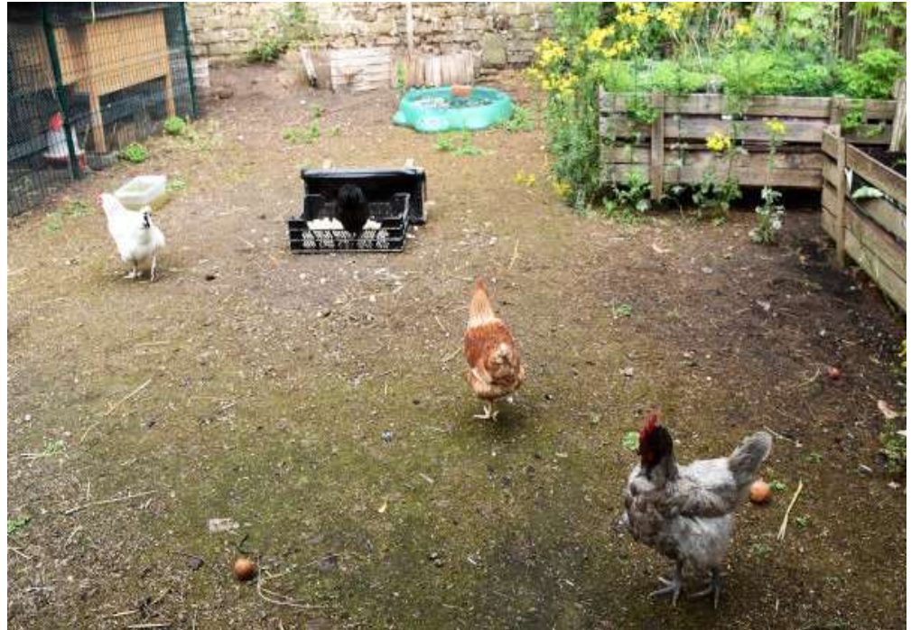
Poulailler de la Cité Messidor - Forest