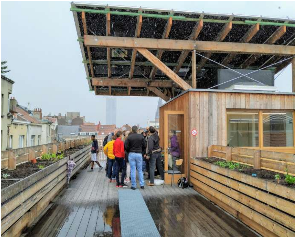
Sur toit / Op de daken