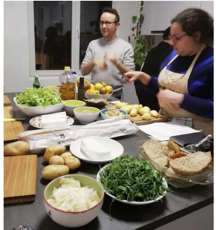
La bonne bouffe - Anderlecht Afvalvrije keuken / Cuisine zéro déchet