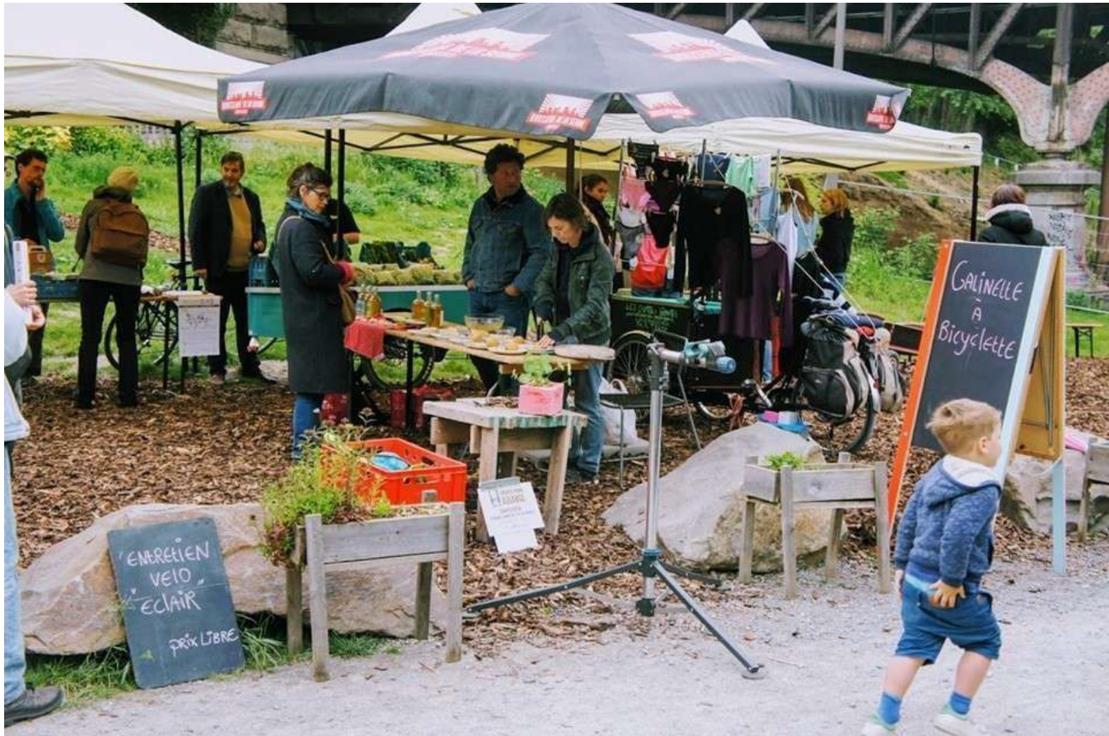
Le marché de la Galinelle, Parckfarm – Molenbeek Marché bio et hyper local... à bicyclette Bilogsische en hyper-lokale markt... met de fiets