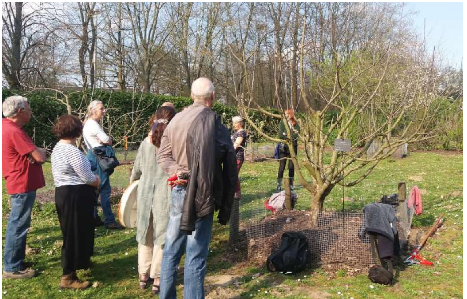
Le verger de la transition - Jette