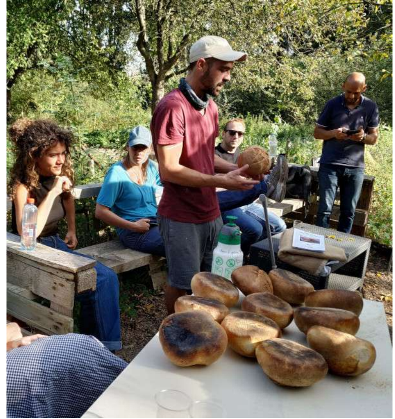
Réseau des fours à pain bruxellois