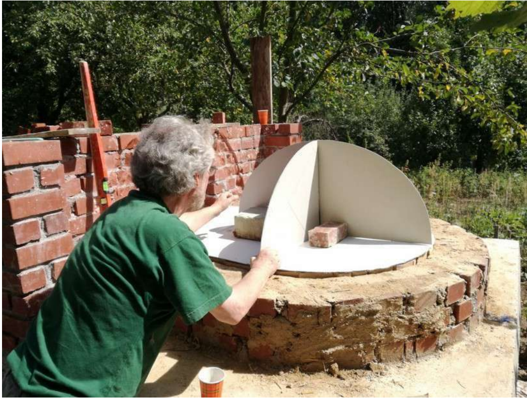
Humana terra - Jette