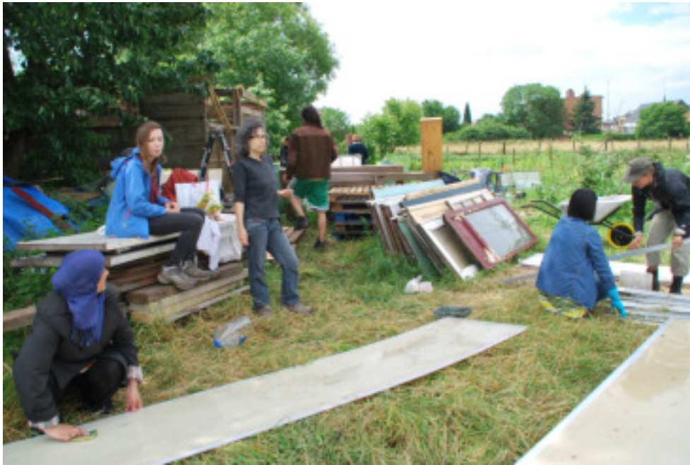
Portes et châssis de récup' pour construire un abri fermé