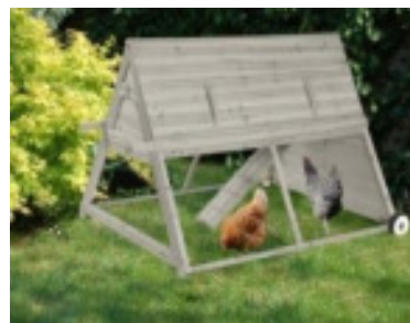
Figure 3 : poulailler mobile